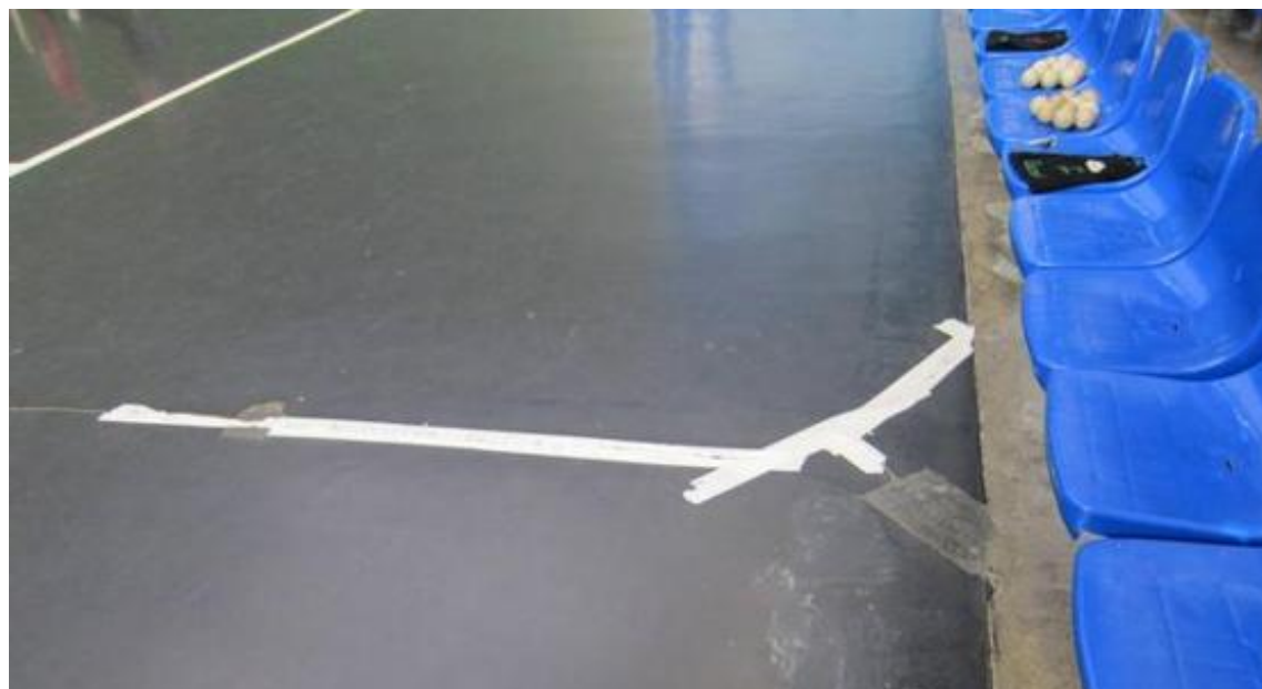
Detalle del estado de algunas zonas del frontón.

Los usuarios habituales del frontón de Unkina, en Usansolo, están hartos de la aparición de grietas en el suelo de este espacio deportivo. Tras la moción presentada por Galdakao Orain después de recoger numerosas quejas, un documento en el que piden que se busquen las posibles razones de estos desperfectos, el Ayuntamiento anuncia que van a reservar 6.270 euros para, según precisan, «arreglar las fisuras derivadas por las diferencias térmicas producidas al pasar de ser un frontón descubierto, como era antes, a uno cubierto».